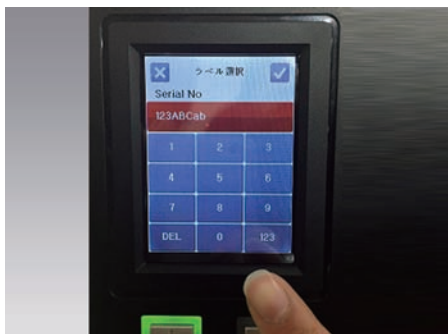
タッチパネルで直接データ入力