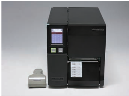
Bluetoothスキャナーによるデータ入力