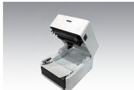
ラベルセットが簡単な全面オープン機能