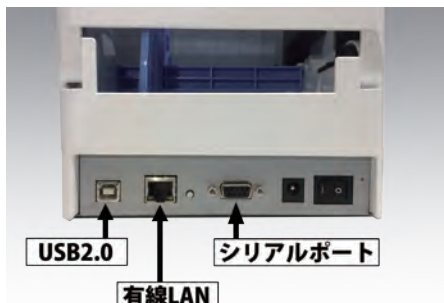
標準インターフェイス