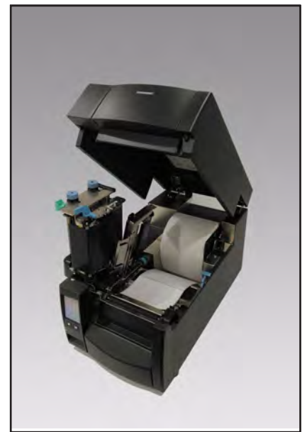
ラベルセットが簡単な コラムシエル機構